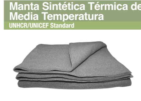
Manta Sintética Térmica de Media Temperatura UNHCR/UNICEF Standard