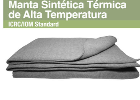
Manta Sintética Térmica de Alta Temperatura ICRC/IOM Standard