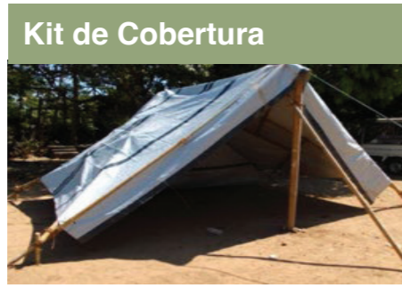
Kit de Cobertura