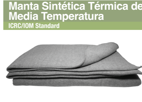
Manta Sintética Térmica de Media Temperatura ICRC/IOM Standard