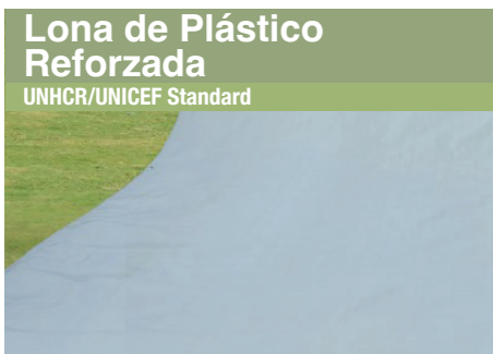
Lona de Plástico Reforzada UNHCR/UNICEF Standard