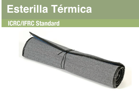
Esterilla Térmica ICRC/IFRC Standard