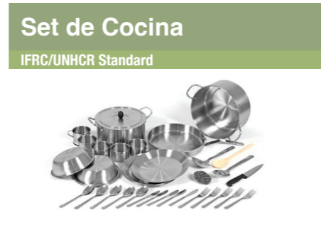
Set de Cocina IFRC/UNHCR Standard