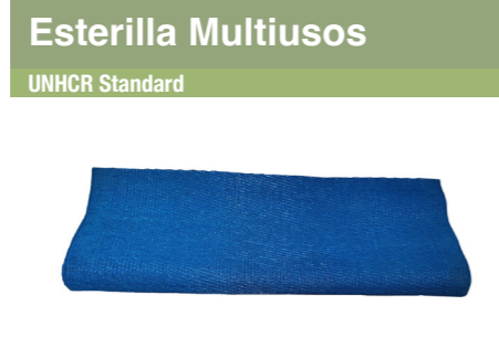
Esterilla Multiusos UNHCR Standard