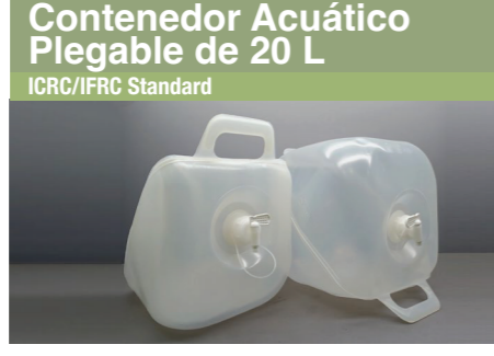
Contenedor Acuático Plegable de 20 L ICRC/IFRC Standard