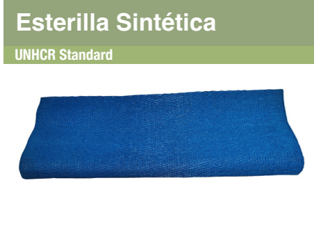
Esterilla Sintética UNHCR Standard