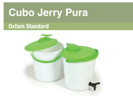
Cubo Jerry Pura Oxfam Standard