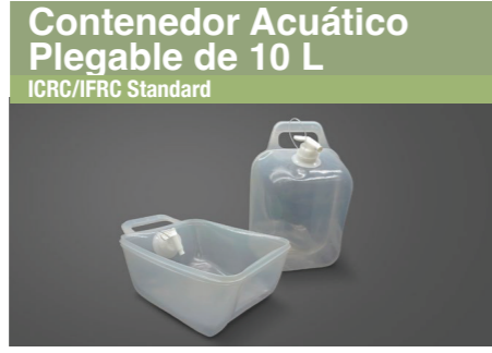
Contenedor Acuático Plegable de 10 L ICRC/IFRC Standard