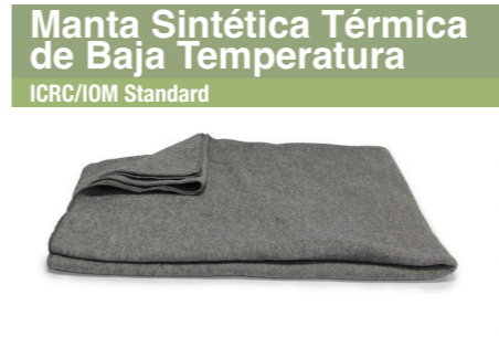
Manta Sintética Térmica de Baja Temperatura ICRC/IOM Standard