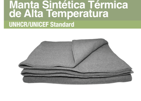
Manta Sintética Térmica de Alta Temperatura UNHCR/UNICEF Standard