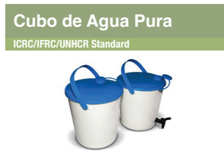
Cubo de Agua Pura ICRC/IFRC/UNHCR Standard