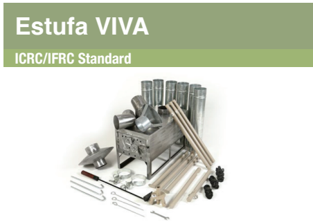
Estufa VIVA ICRC/IFRC Standard