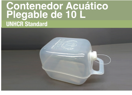
Contenedor Acuático Plegable de 10 L UNHCR Standard